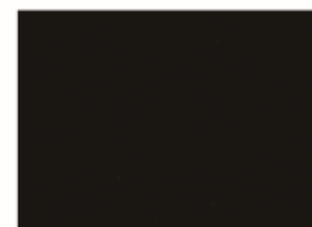
VBあり (VBを含む水で洗浄)