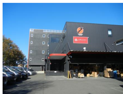
新設いたしました新工場(奥)と本社(手前)

昨年12月に竣工いたしました弊社新工場には、建設予定時より使い捨ておしぼりの加工機のライン導入を計画致しました。