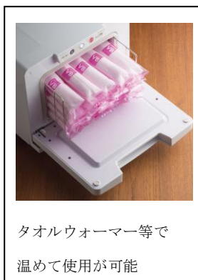
タオルウォーマー等で 温めて使用が可能