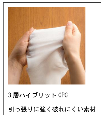
3層ハイブリットCPC 引っ張りに強く破れにくい素材